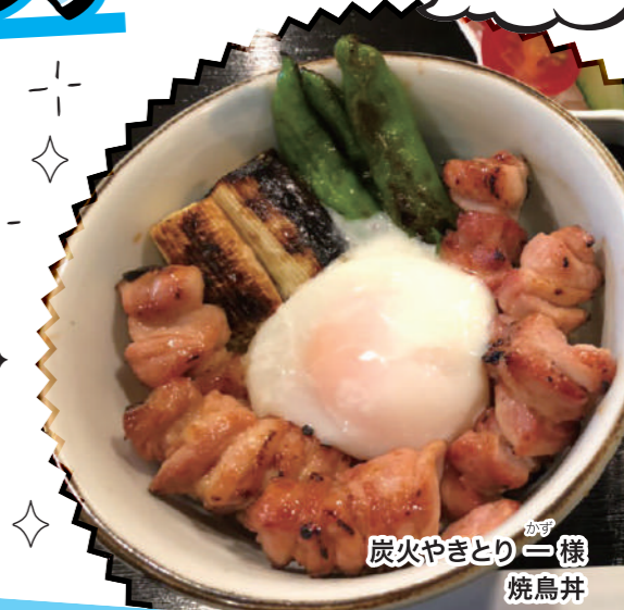
炭火やきとり 焼鳥丼