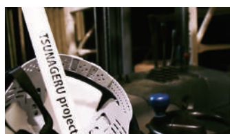
動画のワンシーン。 1本のパトンで「TSUNAGERU」を展開

昨年の経営計画発表会から始まった「エンディング動画」(社内動画)の上映。今年はプロジェクトメンバー7名の企画・制作による、「TSUNAGERU project」をテーマにした超大作の感動動画でした。“TSUNAGERU project パトン”を中心に展開されるストーリーと出演スタッフの演技など、みんなが釘付けになりました。