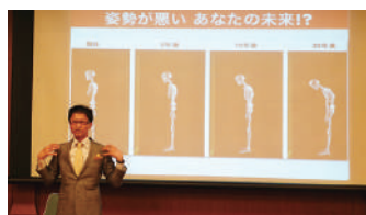
丁寧なレクチャーのあと スタッフもマッサージを実践し、その効果を実感