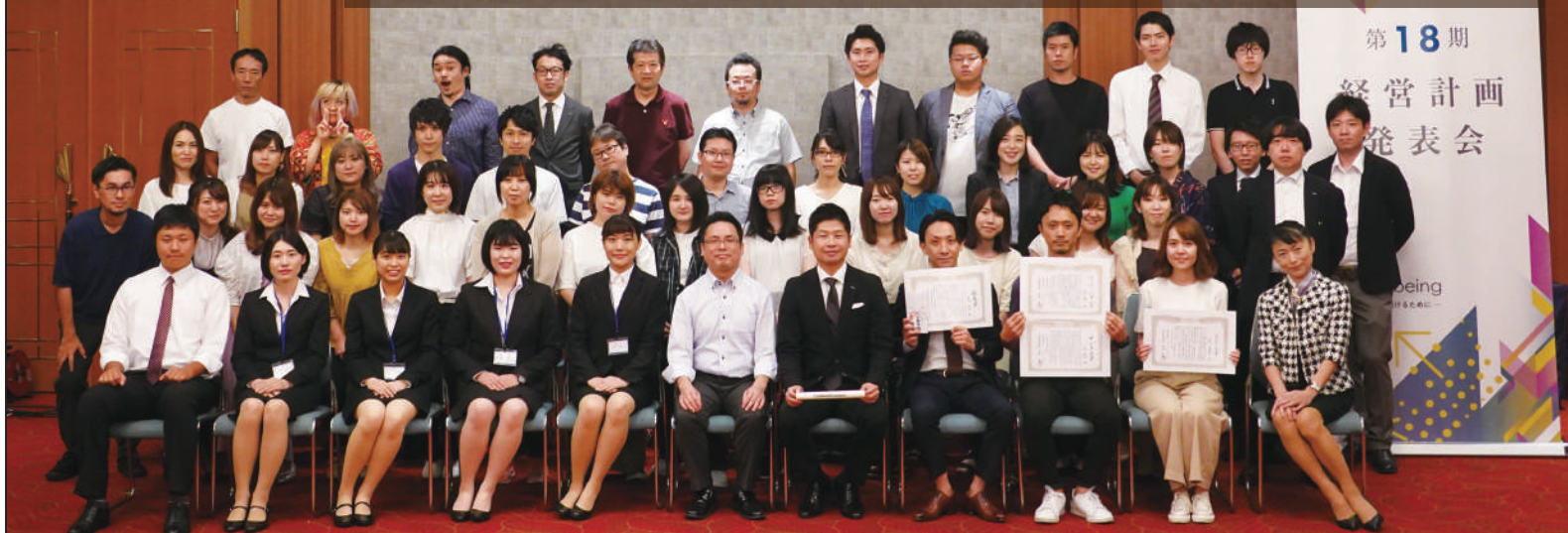
経営計画発表会のラストは、今年の表彰社員や内定者を含む、全員で記念撮影！ 内定者のみなさんには、CRMの考えや社員のことが、より知ることができた一日になったかと思います

毎年7月の第3土曜日は、CRMの最大の社内行事である「経営計画発表会」。 昨年につづき、「メルパルク名古屋」にて、「第18期 経営計画発表会」を開催しました