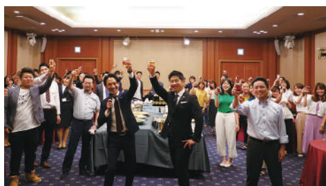
懇親会での乾杯シーン。 じゃんけん大会などで大盛り上がりでした