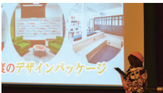
動画を上映し、 わかりやすくプレゼンする新入社員

今年入社した新卒社員による「新人プレゼン」。今年は「VR」を活用した新ビジネスをプレゼンしてくれました。内容は「VRのプラットフォーム」と「VRを活用したオフィス作り」。動画を使って、わかりやすくプレゼンしてくれました。新入社員5名には、よい経験になったと思います。