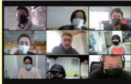
会議はオンラインで実施しています

PF部(プロダクトフォーム部)とセールス部の社員で構成されたチーム。顧客が求める適切かつ一定の品質を担保を目標に始動しました。11月の会議では、ミス&クレームの共有と討議を行い、品質などの各種基準書の作成に向けて、担当を振り分け、また、検品作業の仕組み作りや棚卸しの改善についても話し合いが行われました。