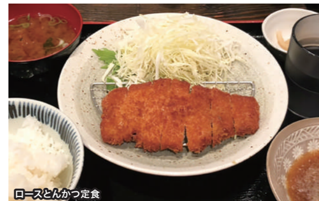
ロースとんかつ定食

「とんかつが食べなくなったら、とにかくココ!」、名古屋オフィスの北側、堀川近くにある豚肉料理の専門店「豚道」の“ロースとんかつ定食”(1000円・税込)をご紹介。とんかつにサッパリのおろしポン酢が絶妙のハーモニーを生み出し、イチオンです。同店は、岐阜県の銘柄豚“ポーノークぎふ”を使用した豚肉料理を楽しめます。