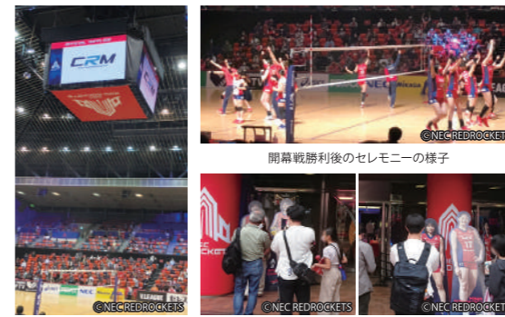
スポンサー紹介のひと場面 試合後、ファンの方々が等身大パネルを撮影されていました