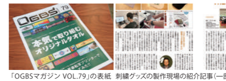
「OGBSマガジン VOL.79」の表紙 刺繍グッズの製作現場の紹介記事(一部)