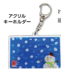
アクリルキーホルダー