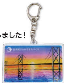
アクリルキーホルダー

施設・団体から二次加工の許可をいただいている作品・アートもあるため、グッズに貴社のロゴなどを入れることもOK。個性豊かなアート作品のグッズに、企業ロゴを入れて、「SDGs×ノベルティグッズ」の取り組みも可能です。また、グッズ以外にもバナースタンドや横断幕など、販促物の製作のご相談も承ります。