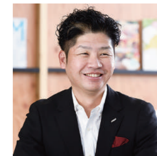
株式会社シー・アール・エム 代表取締役

ロシアによるウクライナ侵攻、世界各地で起こる気候変動、未だに終息しない新型コロナウイルス感染症、子供の貧困など、私達は数多くの課題に直面しています。このままでは、人類が安定して、この世界で暮らし続けることができなくなると心配されています。そんな危機感から、世界中のさまざまな立場の人々が話し合い、課題を整理し、解決方法を考え、2030年までに達成すべき具体的な目標を立てました。それが「持続可能な開発目標(Sustainable Development Goals:SDGs)」です。