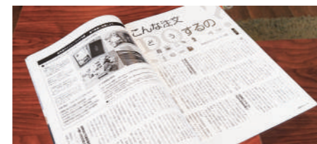
「メニューブックの達人」の紹介記事(一部)