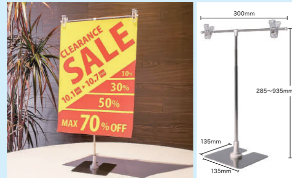
ポスター印刷は合成紙を使用、光沢のない質感で、やぶれにくく耐久性に優れています。高さも、285～935mmまで調整可