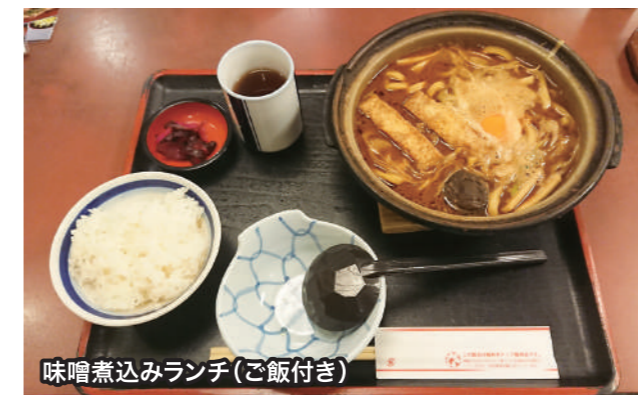
味噌煮込みランチ(ご飯付き)