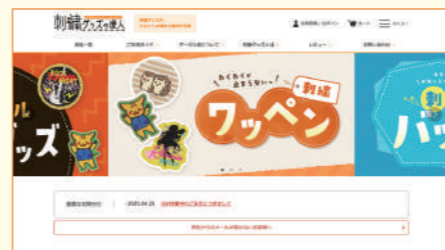
「刺繍グッズの達人」のトップページ