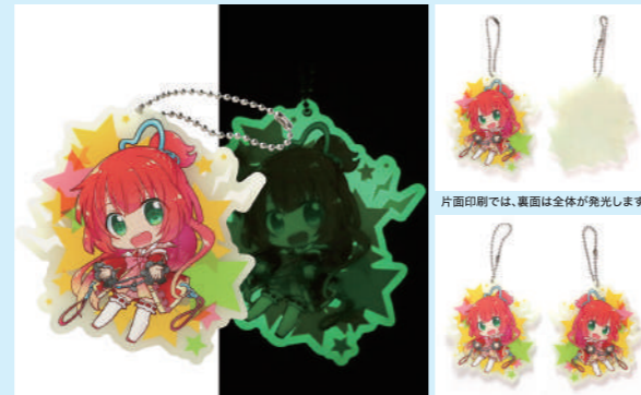
アクリル板が発光するため、印刷がない箇所が多いと、光り具合が異なります。両面印刷も可能です