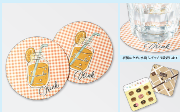
サイズは直径90mm(四角は90×90mm)、使い捨てでも、オシャレなコースターを! 「四角」タイプも同時リリース!