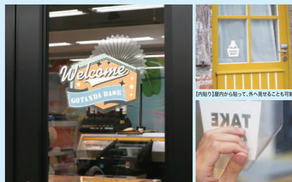
半透明の素材のため、ガラスの裏に貼っても違和感なく活用できます 糊残りせず、キレイにはがせます