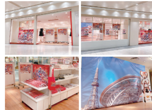
「ミートマショップ」の様子。グッズ販売のほかに、フォトスポットも用意(写真右下)

7/27より、コラボイベント「でらます」を開催。期間限定のミートマショップ也大盛況!