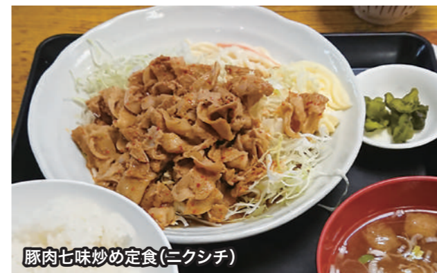
豚肉七味炒め定食(ニクシチ)