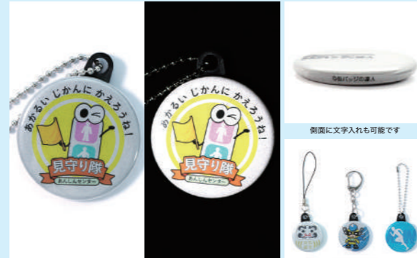
しっかりと反射させるには、「白色の面積を増やす」、「明るい色を背景に」がポイント。アタッチメントは3種類より選択可!

夜道のお守りなど、「光る」特性を活かしたグッズを! 「缶バッジの達人」より、車のライトなどで反射して光る、「リフレクター缶キーホルダー」が新登場。キーホルダータイプのため、カバンなどに穴を開けずに付けられます。サイズは円形32mmと38mmを用意。1デザインにつき、10個単位で製作できます。また、本製作前に、仕上がりや色味を確認できる「お試し製作」もあり(別途オプション)。詳細は、Webサイトをチェック!