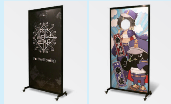
キャスター付きパネル印刷 顔出しキャスター付きパネル印刷

キャスターでらくらく移動! フレーム付き大判パネル 「大判プリントの達人」より、「キャスター付きパネル印刷」をリリース。本体サイズは W955×H1925×D365mmで、デザインパーテーションやブース内のブロック分けなど、使いみちは様々です。また、両面印刷も可能で、両面別柄のデザインももちろんOK。さらに、イベントなどで大活躍の「顔出しキャスター付きパネル印刷」も同時リリース。詳細は、Webサイトにて。