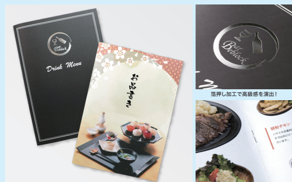
紙の素材感を重視した「中綴じメニューブック」に「箔押し加工」をプラス 冊子のように、ホチキスで綴じる仕様

シンプルな冊子タイプのメニューブックに「箔押し」を「メニューブックの達人」より、冊子タイプの「中綴じメニューブック」に「箔押し加工」ができる「中綴じ箔押しメニュー」が新登場。箔押しのカラーは、金・銀など、5色より選択可能です。店舗のロゴなどを箔押しすることにより、高級感を演出。センターをホチキス綴じる仕様のため、中面ページをさっくり見開いて、メニューを見ることが出来ます。詳細は、Webサイトにて。