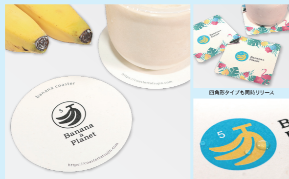
少シクリーム色で、繊維の粒が残りやす模様があるのが特徴のバナナペーパー 水滴がついても印刷の色にじみが少ないです