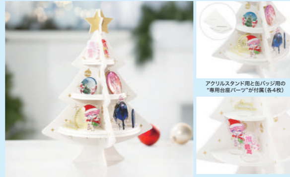
推しグッズを飾って、楽しめよう! ※アクリルスタンド・缶バッジは付属しません もちろん、「専用台座パーツ」を使わず お気に入りの台座で自由な配置もOK