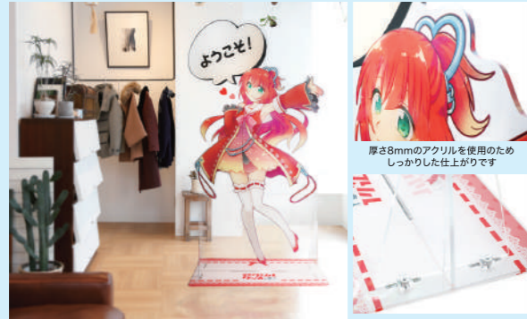
自宅に飾って推し活、イベント会場で飾って販促など、用途は様々！ 台座の印刷もOK！ 本体と台座はネジやナットで固定します