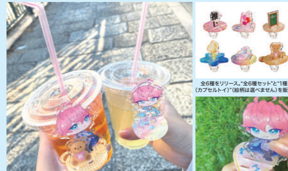
全6種をリリース。「全6種セット」と1種(カプセルタイプ)(価格は選べません)を販売