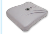
注水タンクを標準装備