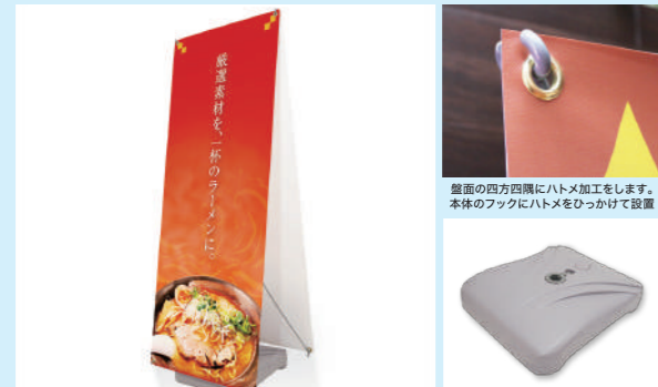
壁面の四方四隅にハトメ加工をします。本体のフックにハトメを引っかけて設置