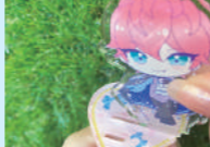
屋外でも楽しめる押し活グッズ。撮影した画像をSNSに投稿して、楽しむことも! 厚さ3mmであれば、アクスタのみならず、アクリルキーリングにセットできます