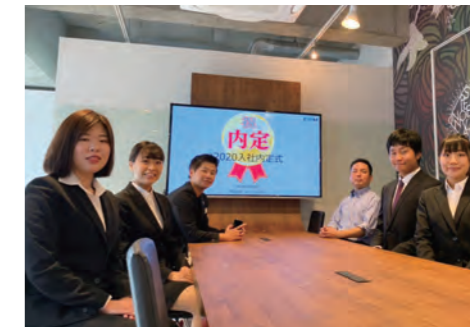
アットホームな雰囲気で行われた内定式

10月1日(火)、名古屋オフィスにて2020年新卒入社の内定式を行いました。今年は、4名の内定者が参加。7月の「経営計画発表会」以来の再会となりましたが、みんな元気な姿を見せてくれました。内定式では社長より「経営理念」についての講話、「組織」についてのグループワークなどを実施。最後は食事をして、終始アットホームな雰囲気で行われた内定式。内定者は、年明け1月の「半期経営計画進捗会議」にも出席予定。社員一同、みなさんとお会いできることを楽しみにしています。なお、高卒採用は現在進行中です。