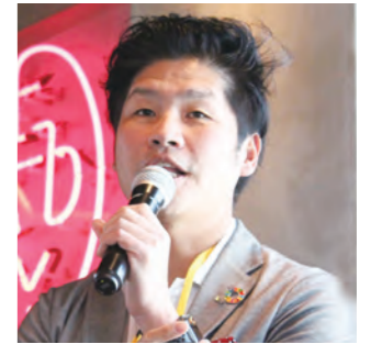
株式会社シー・アール・エム 代表取締役

みなさん、「リンゲルマン効果」という心理学用語をご存じでしょうか？答えを先に言いますと、「個人で作業するよりも集団で作業するほうが、一人ひとりの能力が低下する」現象をいい、「社会的手抜き」ともいわれています。要するに、「人間は集団になればなるほど、手抜きをする」という心理です。小学校の運動会で、徒競走の経験は誰でもあるかと思いますが。徒競走は、責任も成果も、100%個人にあります。では、綱引きだったらどうでしょうか？40人のクラス対抗で綱引きしたとき、無意識に少し力を抜いた経験はないでしょうか？私があります(笑)。