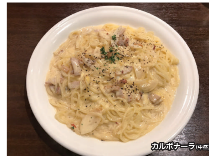
カルボナーラ(中盛)

CRMの社内制度のひとつに「サタデーランチ」があります。この制度は月イチの土曜出勤時に一人1000円の食事代が支給されるもので、各拠点ごとにスタッフみんなでちょっとリッチに楽しく食事をしています。そこで、各拠点のおすすめのランチをご紹介します！