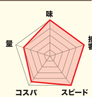
味 食感 分量 コスパ スピード

創業以来、約65年間、鶏肉一筋の老舗鶏肉専門店。普段のランチタイムでは、弁当や惣菜目当てのお客で行列ができる人気店です。特に、秘伝の特製焼き鶏ダレを使用した「焼き鶏丼」(550円・税込)はおすすめ！