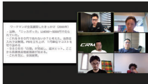
各拠点&テレワーク(自宅)にて実施!

読書会をオンラインにして良かった点として、各自割り当てられた“章”の内容を発表する際、今までは手書きでサマリーを作成していたのですが、パソコンでの作成(Googleスライドで作成)となり、作成時間が短縮できました。また、サマリーをまとめやすく、見やすくなったのも大きな利点と言えます。同書から得た学びとして、マーケティング部のマネージャーは「データ経営の部分において、データを取るクセ、活かすスキルが両方とも足りないと感じました。売価絶対主義(「売価=お客様が喜んで購入して下さる価格」が先にあること)にも共感を得ました」とのこと、実り多い読書会を行うことができました。