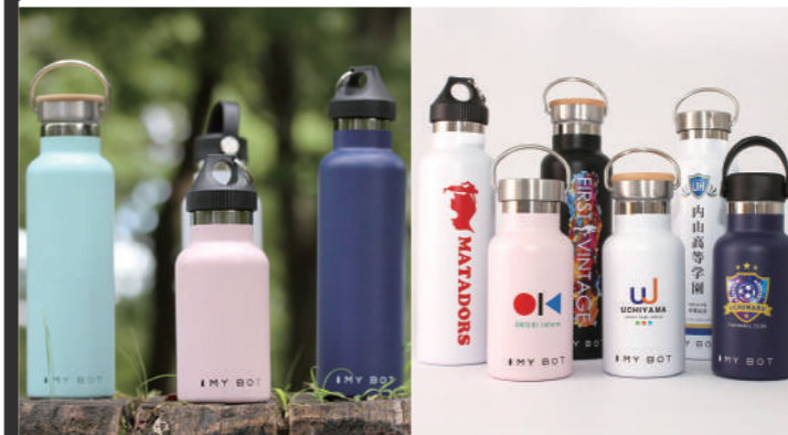
「印刷あり」は「フンポイント印刷」と「全面(約360度)印刷」の2種を用意。もちろん、「印刷なし」の「MYBOT」も購入できます!

前号で紹介しました、あなた好みにアップデートできるステンレスボトル「MY BOT」のMakuakeでの先行販売ですが、おかげさまで、先日目標金額を達成しました。ご支援者の皆さま、ありがとうございました。さて、先行販売も残り1ヶ月を切り、「印刷ありのMY BOT」のデータ制作において、弊社にてデータ制作アシストを開始しました。アシスト内容の詳細は「Makuake」サイトの活動レポート参照、またはメッセージでお問い合わせください。先行販売は10月19日(月)の18時までです!