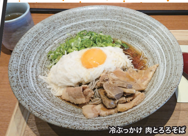
冷ぶっかけ 肉とろろそば

“健康経営”に取り組む CRM! 健康には良い食事が不可欠です。また10月となり、食欲の秋へと突入ということで、このコーナーではオフィス近隣の「おすすめのランチメニュー」を紹介します。