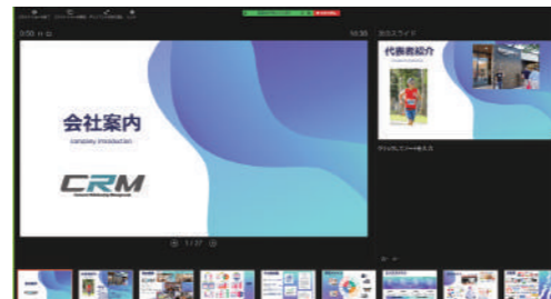
画面共有ほか、Zoomのツールを活用し運営!

インターンシップの主な内容は、会社説明やワークショップ、営業社員によるセールスの仕事の話&質問タイムなどです。さっそく、オンラインの強みのひとつが成果として表れ、北は北海道から南は九州まで、数多くの学生が参加しました。また、Googleスライドを活用したワークショップの進行もオンラインならではの、インターンシップセカンド(第2弾)を行い、年内いっぱい東京採用の活動は続きます!