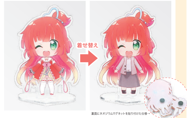
裏面にネオジウムマグネットを貼り付けた仕様