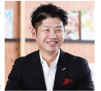
株式会社シー・アール・エム 代表取締役

私が学生の頃、カーナビは超高級品で、搭載されている車を見て感動した覚えがあります。今では多くの車に標準で搭載されているため、車の免許がない人でもカーナビに触れたことはあるかと思います。目的地を設定したら、あとはカーナビの指示に従って運転すれば、ベストなルートで目的地に着けるので、今では欠かせないものです。たとえば、カーナビがない車でスマホの“Google マップ”を使えば、同じことが可能です。