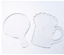
デザイン(形状)は2種、10枚セットで販売！ ハンディタイプのフェイスシールドです