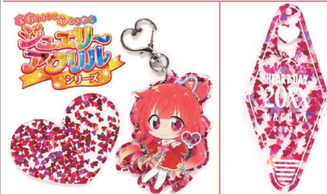
両面赤色のハートは、光によって紫やオレンジ、緑にも輝きます