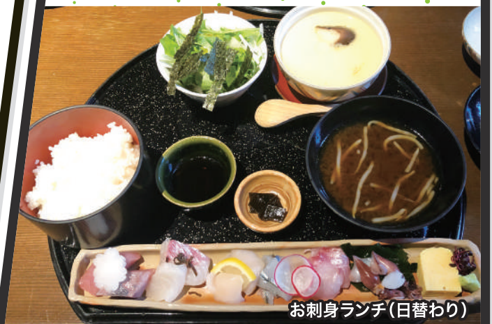
お刺身ランチ(日替わり)

「健康経営」に取り組む CRM！健康には良い食事が不可欠です。2021年も美味しい料理を食べて、元気に過ごしていきたい。ということで、このコーナーではオフィス近隣の「おすすめのランチメニュー」を紹介します。