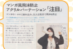
「スコブル」の表紙と誌面。この商品はホワイトボード用マーカーで書き消しできます

また、7月にはサイン&ディスプレイ業界の専門メディア「総合報道」の7月15日号・7月25日号合併号にて、「大判プリントの達人」の商品の“透けない両面印刷タペストリー”が紹介されました。こちらの商品は6月11日リリースしたばかりの新商品。商品企画・開発に携わった部門長と製造部門の社員が取材、インタビューを受けた記事となります(写真左)。