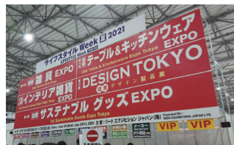
多くの展示会が同時開催され、見応えがありました!

なお、8月1日からの第20期から、新しいCFに生まれ変わりました。詳細は、今後の「CRMニュースレター」にてご紹介します。