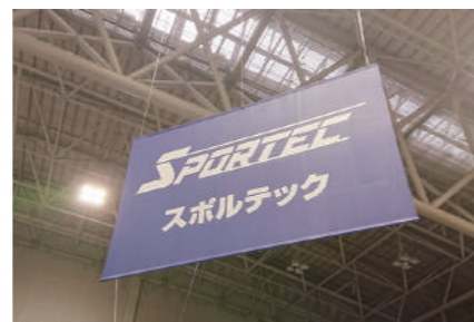
ポートメッセなごやで開催された“SPORTEC 2021”

3日間、足もとの悪い日もありましたが、CRMブースに足を運んでいただきまして、ありがとうございました。商品のご相談などは、お気軽に営業担当まで、お問い合わせください。