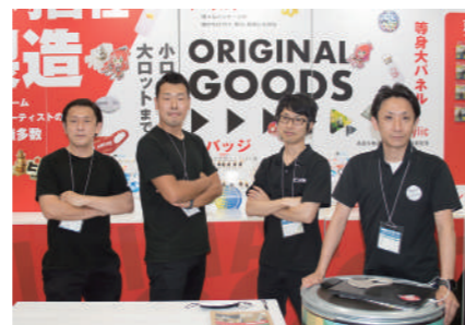
展示会に参加した、名古屋営業チーム一同