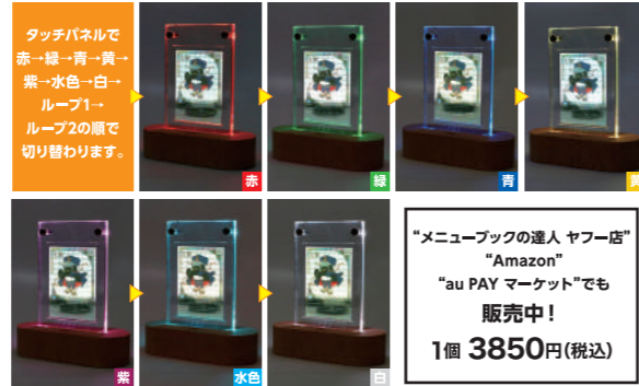
タッチパネルで赤・緑・青・黄・紫・水色・白・ブルーの7色で切り替わります。

「メニューブックの達人 楽天市場店」より、人気の“シールドPROシリーズ”から、“光る木製台座付き”が新登場。タッチパネル操作で7色に光りますので、お手持ちのトレーディングカードをカッコよくコレクションできます。また、木製台座のほかに金属製のビス足もセットで付きますので、シンプルなディスプレイも可能。詳細は、Webサイトに。