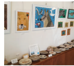
「アラカルト作品展"WE ARE ARTIST!"」の様子