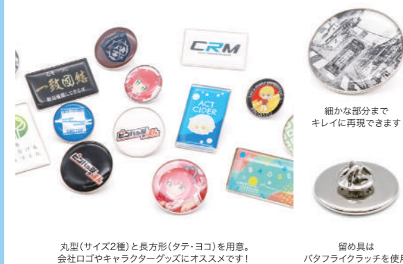
細かな部分までキレに再現できます

昨年末、「ピンバッジの達人」よりリリースした“ドーム型ピンバッジ”(簡易ピンバッジ)は、お急ぎの方にオススメの最短5営業日発送でご納品。CMYK印刷のためデザインの再現性が高く、さらに表面の樹脂コーティングにより、ツヤのある美しい仕上がりを実現しています。価格やサイズなど、詳細はWebページをご覧ください!