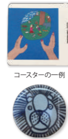
コースターの一例