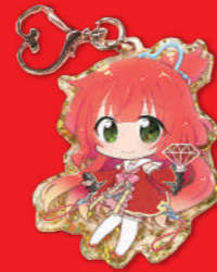
「ジュエリーアクリル」の一例 クラッシュゴールド

アクリルグッズの達人 公式キャラクター「アクト」 所要所で登場! 皆さん、チェックしてね!