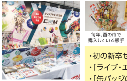
2017年の展示会の弊社ブース