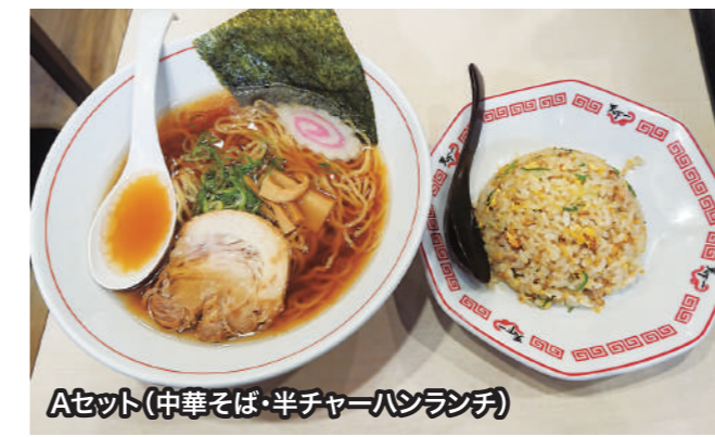
Aセット(中華そば・半チャーハンランチ)