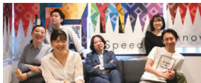
女性社員が加入後の東京メンバー！(2019年撮影)