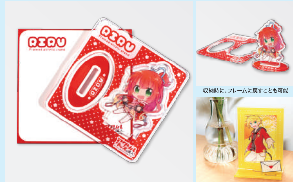
本体と台紙をセットにして、OPP袋に封入します