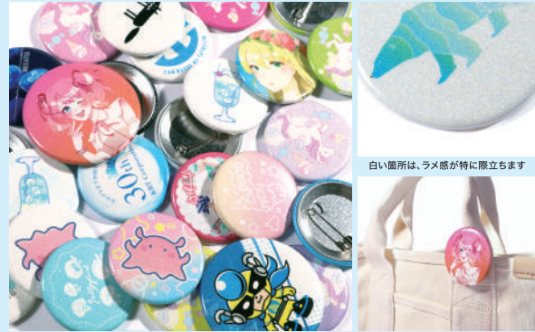
文字やロゴ、イラストなど、シンプルなデザインにオススメです