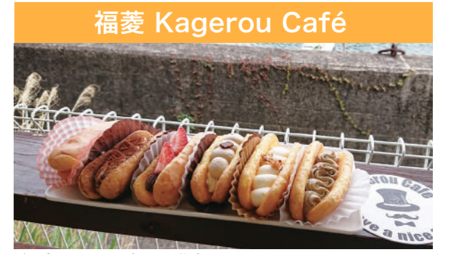
“生かげろう B-ミックス”(1100円・税込)。 左からカスタード&生クリーム、ティラミス、あんいちご、カフェオレ、塩ミルク、ほうじ茶

BeBlockでは、入社満5年以上の社員に、連続5日間のリフレッシュ休暇を取得できます。今回は、リフレッシュ休暇を利用してのオススメの“旅グルメ”を紹介します!