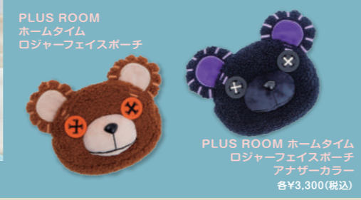
PLUS ROOM ホームタイム ロジャーフェイスポーチ アナザーカラー 各¥3,300(税込)

“キャラクターの再現性”と“触り心地のよい生地”にこだわった「PLUS ROOM」。キャラクターの個性を忠実に再現したルームウェアや、見た目もかわいく、普段の生活に癒しを与えてくれる生活雑貨などをリリースしていく予定です。ルームウェアは、ゆったりサイズ。ゆるく着用でき、リラックスタイムにオススメです。