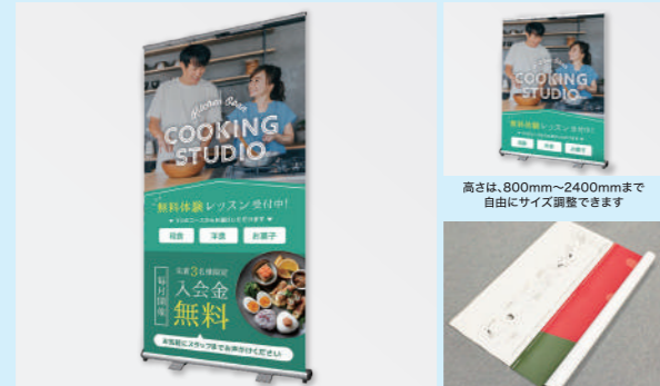
「本体+パネル+盤面印刷のセット」を購入した場合、盤面を取り付けた状態で納品します