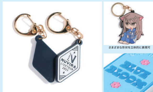
ロゴやキャラクターなど、オリジナルデザインで、小ロット100個からラバーキーホルダー・ストラップを製作