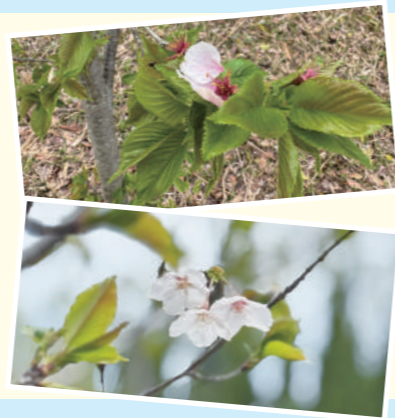
小梅緑地(名古屋市守山区) BeBlockの桜守り隊

今年も5月号は、BeBlockの春の出来事を厳選して、ご紹介。 出会いあり、イベントありの季節でした!