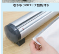
巻き取りのロック機能付き