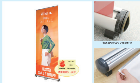
高さは800mm~2400mmまで、自由にサイズ調整可能。シーンに合わせて、表示サイズを柔軟に設定できます。