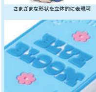
印刷ではできない、立体的な凹凸のある表現が可能です