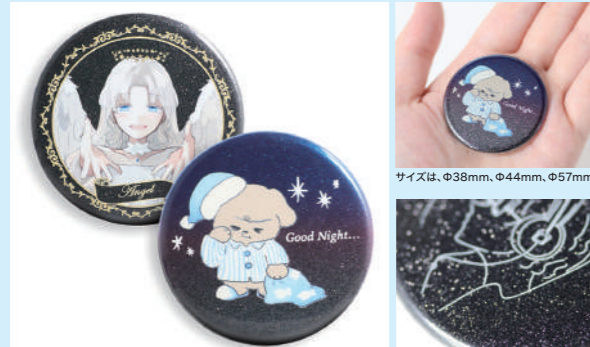
*黒グリッター缶バッジは白押さえがない部分は黒色が透け、色味がゆがんで見えます。K100%のみを使用したデザインを除き、白押さえの作成が必要となります