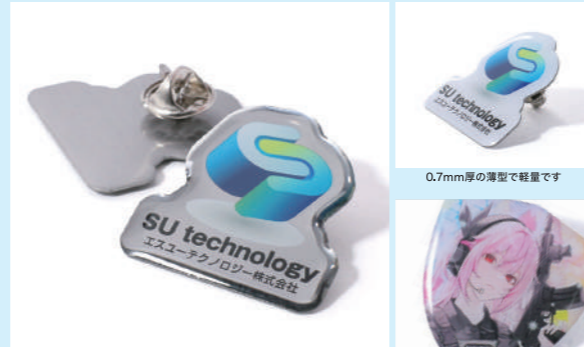
フルカラー印刷でグラデーションも再現できる「ステンレスピンバッジ」。留め具は「バタフライクラッチ」、「タイタックピン」など、4種から選べます